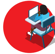
Stagiaire distant chez lui ou en entreprise