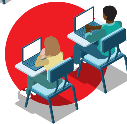
Stagiaires distants dans une salle M2i

A l'aide de technologies innovantes, M2i Formation propose à des apprenants distants de participer à une formation présentielle.